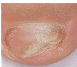
Vor der Behandlung