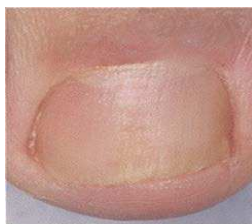
Nach der Behandlung