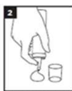
Behältnis senkrecht nach unten halten