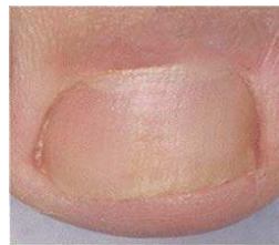
Nach der Behandlung