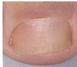
Nach der Behandlung