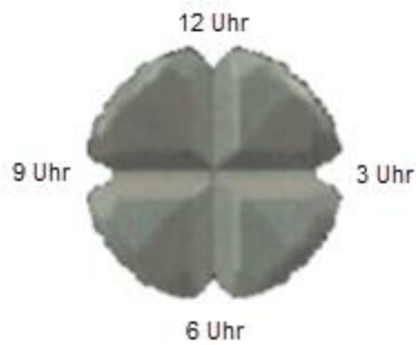
Abbildung 1 – Ausrichtung der Tabletten

2. Legen Sie Ihren Daumen auf die Tablettenoberfläche, so dass Ihr Daumen mit der 3 Uhr- bis 9 Uhr - Richtung übereinstimmt.