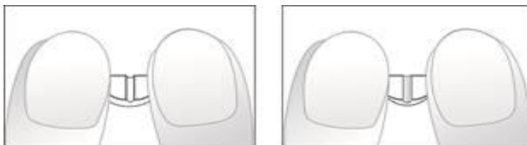
Abbildungen 3 und 4: Leichtes Brechen der halben Nebivolol AmaroX 5-mg-Tablette mit Kreuzbruchkerbe in zwei Viertel.