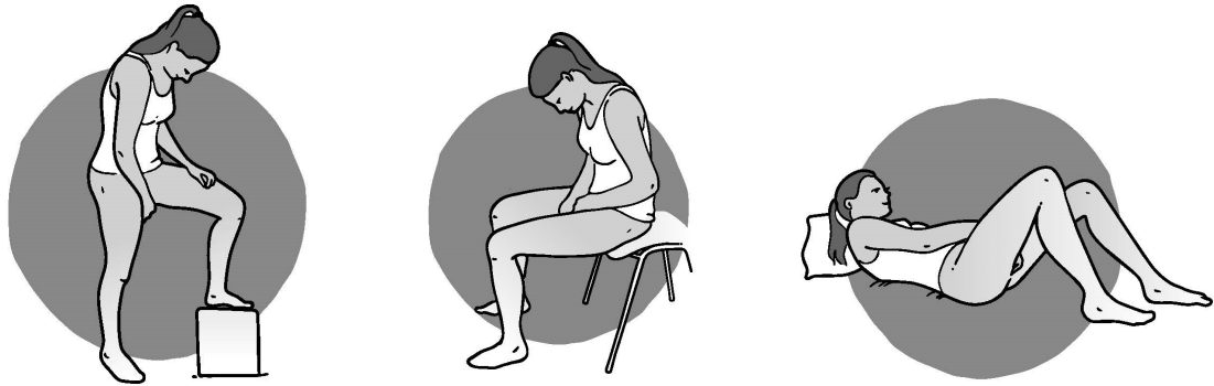
Abbildung 3 Nehmen Sie zum Einlegen des Rings eine bequeme Haltung ein.