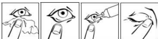
Esquema 1 Esquema 2 Esquema 3 Esquema 4