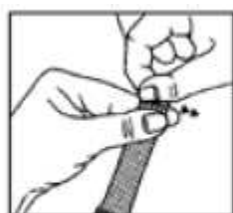
Apretar y rasgar