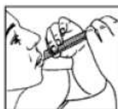
Llevar a la boca presionar y extraer

Si los síntomas empeoran o persisten después de 7 días debe consultar a su médico.