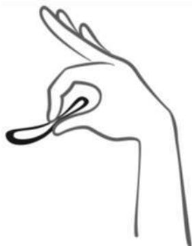
Figura 2 Presione el anillo