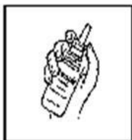
2. Colocar en la mano sujetando el frasco entre la palma y los dedos índice y pulgar.