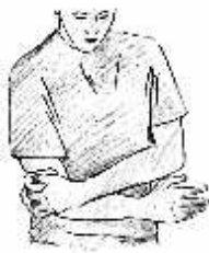
Fig. 1 Lavar e secar cuidadosamente a zona afetada